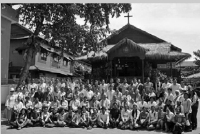
មូកសរុបការងារ និង រៀបចំ ផែនការយុទ្ធសាស្ត្រ ៥ឆ្នាំនៃភូមិ ភាគ បាត់ដំបង