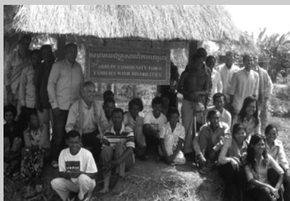
ពិធីបិទឆ្នាំសហគមន៍របស់ក្រុម អភិវឌ្ឍន៍មណ្ឌលរេម៉េ