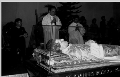
រូបក្រមនៃសន្តិយុទ្ធសាសនាបូកស្រុះ សុខទុក្ខកម្ពុជា