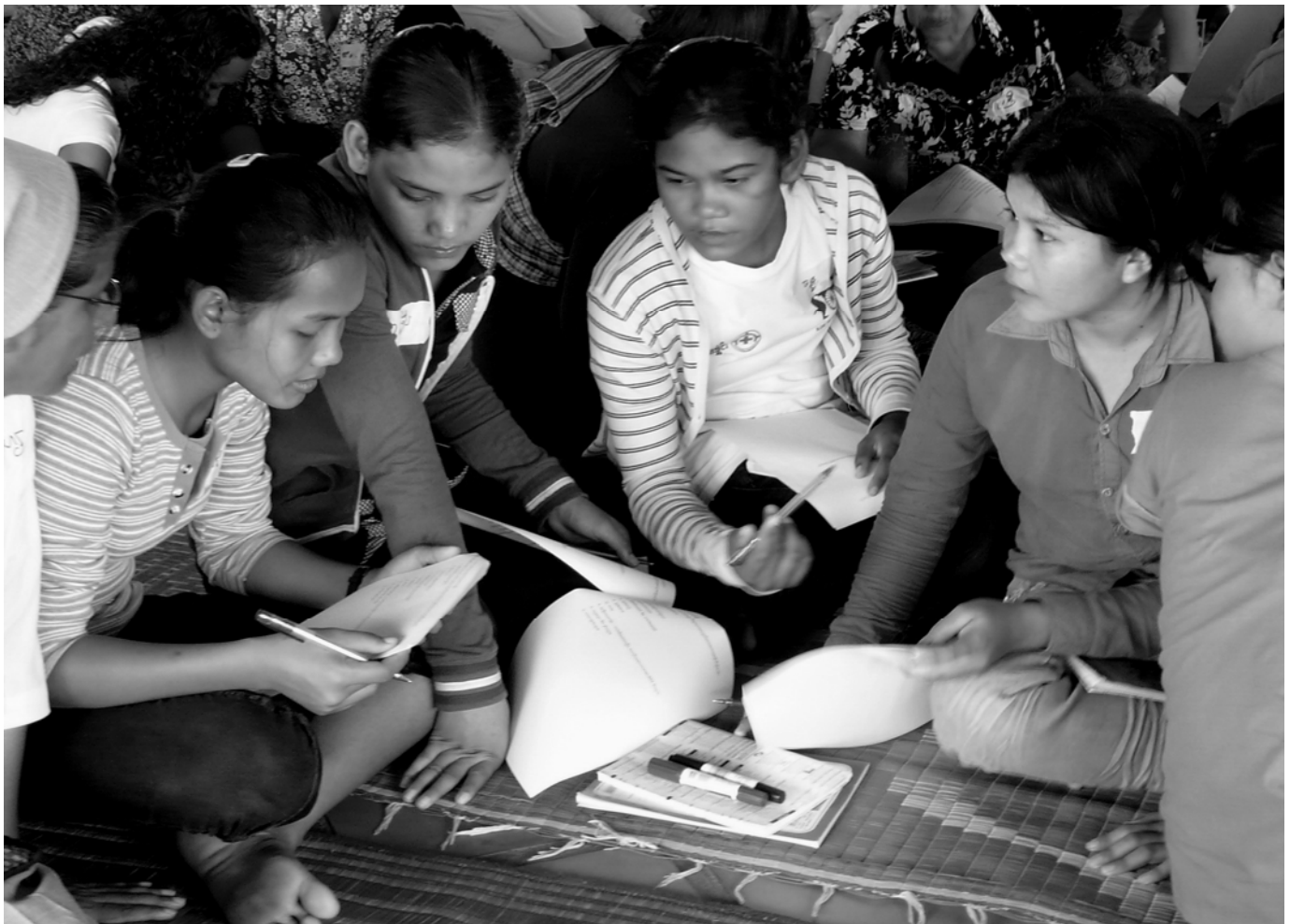
យុវសិស្សពីមជ្ឈមណ្ឌល អក្ខរកម្មវិជ្ជាជីវៈដុនបូស្កូសំរាប់ស្ត្រីបងស្រីសាលាស៊ាន ចូលទទួលរួម ការអប់រំបន្ថែមលើសុខភាពស្ត្រី នៅព្រះសហគមន៍កាតូលិកបាត់ដំបង នៅថ្ងៃសិទ្ធិនារី ២០១០